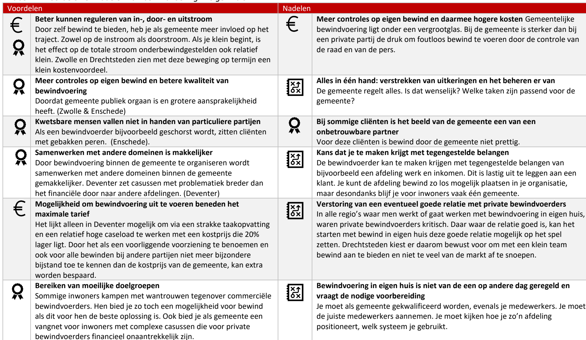
Tabel 4.1 Voordelen en nadelen van bewindvoering in eigen huis